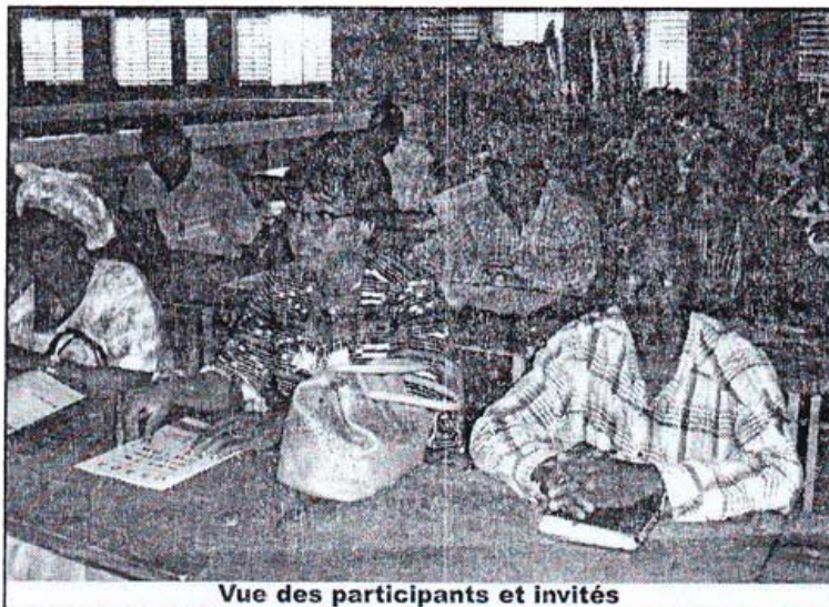
Vue des participants et invités

Le traité institue la primauté des Actes uniformes sur le droit national et leur applicabilité directe.